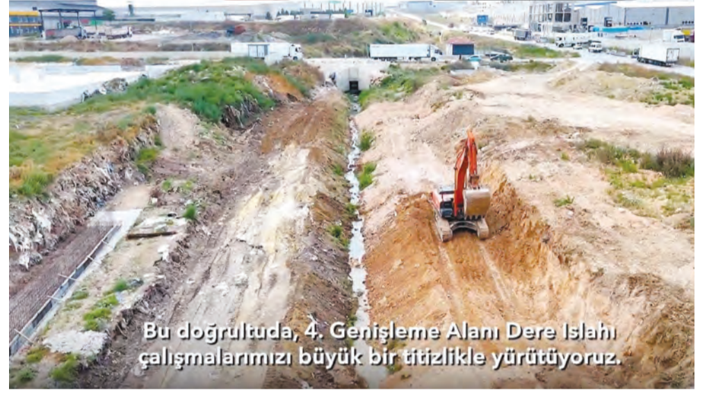
Bu doğrultuda, 4. Genişleme Alanı Dere Islahı çalışmalarımızı büyük bir titizlikle yürütüyoruz.