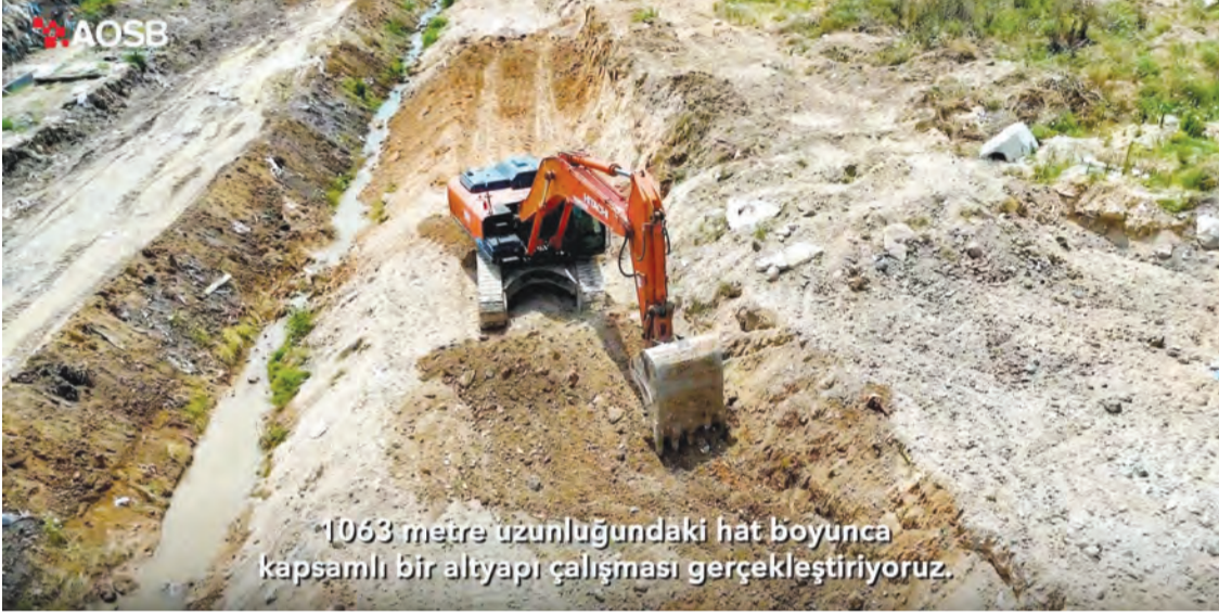
1.063 metre uzunluğundaki hat boyunca kapsamlı bir altyapı çalışması gerçekleştiriyoruz.

Başkan Sütçü, 'AOSB'de sürdürülen altyapı yatırımları yalnızca mevcut sanayi tesislerinin güvenliğini artırmakla kalmayıp, yeni yatırımlar için de daha güçlü bir altyapı oluşturacak' dedi.