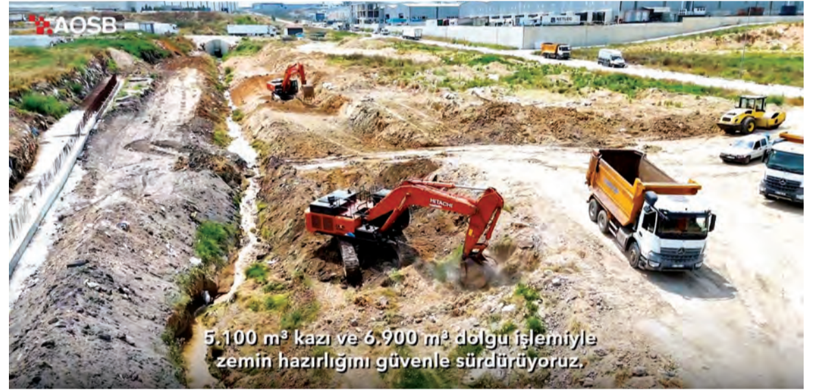
5.100 m³ kazı ve 6.900 m³ dolgu işlemiyle zemin hazırlığını güvenle sürdürüyoruz.