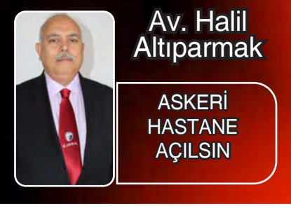
Av. Halil Altıparmak