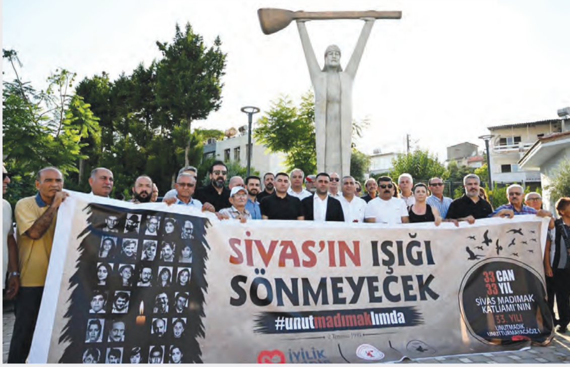
Başkan Kozay: Toplumsal hafızayı canlı tutmak ortak sorumluluğumuzdur