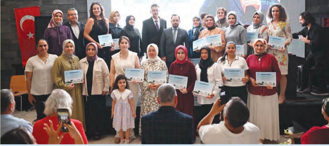
Adana'nın yetiştirdiği önemli halk ozanlarından merhum Cahit Seyhanlı, Sarıçam'da düzenlenen anlamlı programla anıldı. Sarıçam Belediyesi ile Sarıçam Halk Eğitimi Merkezi iş birliğinde gerçekleştirilen yıl sonu sertifika töreninde 253 kursiyer belgelerini alırken, Adana'nın sanat mirasına da sahip çıkıldı.