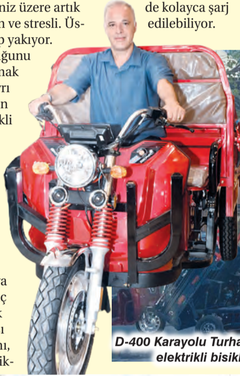
D-400 Karayolu Turhan Cemal Beriker Bulvarı üzerinde faaliyet gösteren Moto Center, her bütçeye ve ihtiyaca hitap eden geniş elektrikli bisiklet ile motosiklet yelpazesıyla alternatif ulaşım arayan Adanalıların yoğun uğrak noktası haline geldi