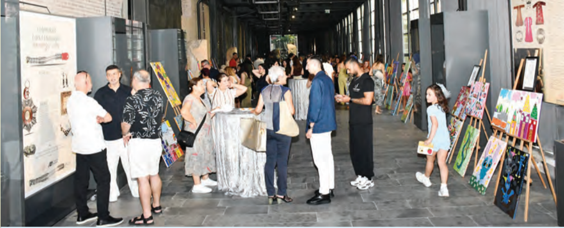
"Fİ Sanat Atölyesi" sergisi, Adana Müzesi'nin tarihi atmosferinde düzenlenen görkemli bir açılış kokteyli ile kapılarını araladı

Kültürün, tarihin ve sanatın harmanlandığı Adana Müzesi, çok özel bir sergiye ev sahipliği yaptı