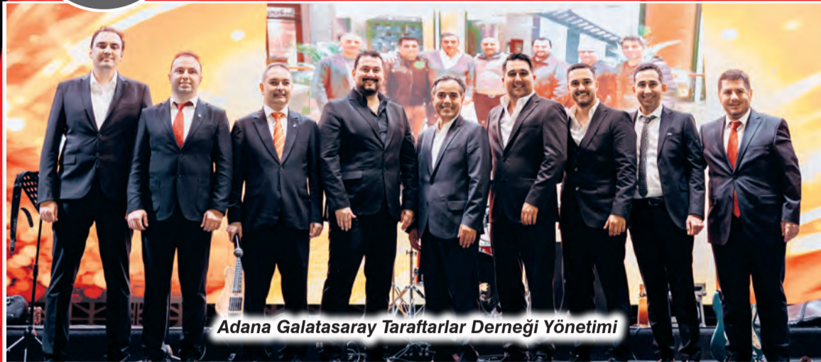
Adana Galatasaray Taraftarlar Derneği Yönetimi

Yoğun katılımın ve yüksek enerjinin damga vurduğu şampiyonluk galası, Galatasaray taraftarlarını bir araya getirirken, Adana'da uzun süre konuşulacak organizasyonlardan biri olarak gözlemlendi. Sarı-kırmızılı camianın 26. şampiyonluk sevinci, gece boyunca coşku ve gurur içinde kutlandı.