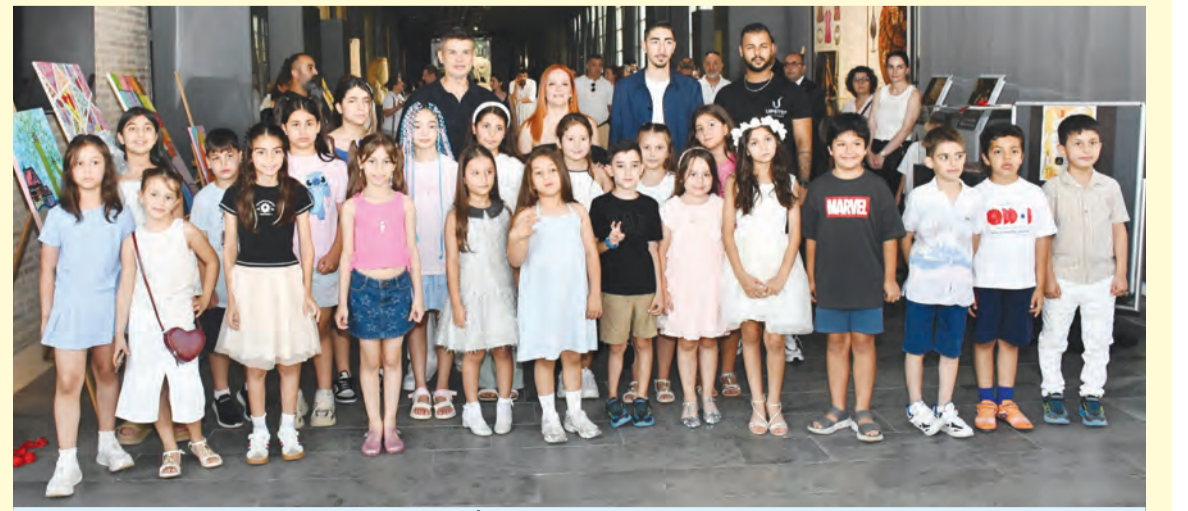
Genç yetenekler, kursiyerler ve aileleri "Fİ Sanat Atölyesi" resim sergisinin sonunda hatıra fotoğrafı çekildi