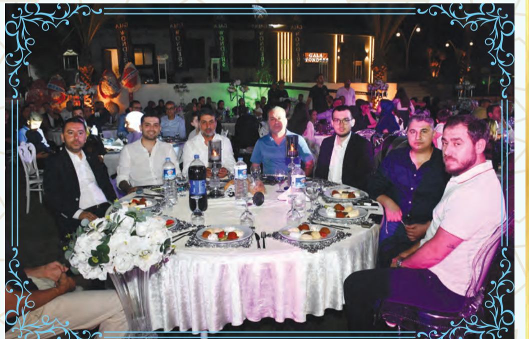
Kentin sosyal yaşamına damga vuran görkemli düğün; iş, siyaset, spor ve cemiyet hayatının önde gelen isimlerini bir araya getirdi