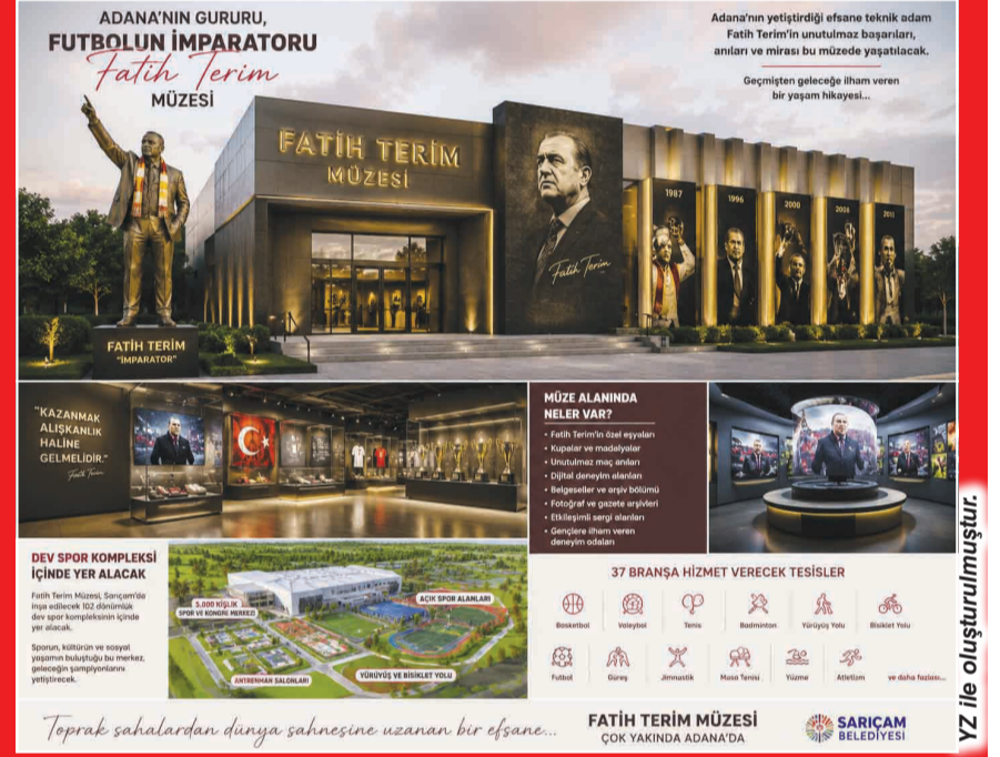
Toprak sahalardan dünya sahnesine uzanan bir efsane... FATİH TERİM MÜZESİ ÇOK YAKINDA ADANA'DA