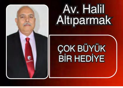
Av. Halil Altıparmak