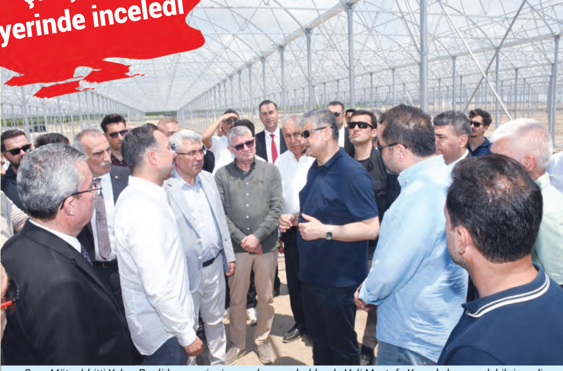
Sera Mühahhiti Yalım Benlidayı, projenin son durumu hakkında Vali Mustafa Yavuz'a kapsamlı bilgi verdi

Vali Mustafa Yavuz, Karataş'ta kurulum çalışmaları tüm hızıyla süren Tarıma Dayalı İhtisas (Sera) Organize Tarım Bölgesi'ni ziyaret ederek yürütülen çalışmaları yerinde denetledi