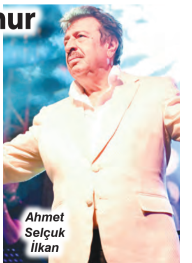
Ahmet Selçuk İlkan

→ Yarım asırlık sanat hayatında kaleme aldığı eserlerle milyonların gönlünde taht kuran Ahmet Selçuk İlkan, doğduğu şehir Adana'da başlayan 50. sanat yılı yolculuğunun ilk konserinde sevenleriyle Sarıçam'da Ferdi Tayfur Sanat Merkezi ve Müzesinde buluştu. Gece boyunca sanatçının unutulmaz şiirleri ve eserleri büyük beğeni toplarken, yurt dışından Türkiye'nin dört bir yanından gelerek, alanı dolduran sanatseverler duygu dolu anlar yaşadı. ↪ Haberi 4. Sayfada