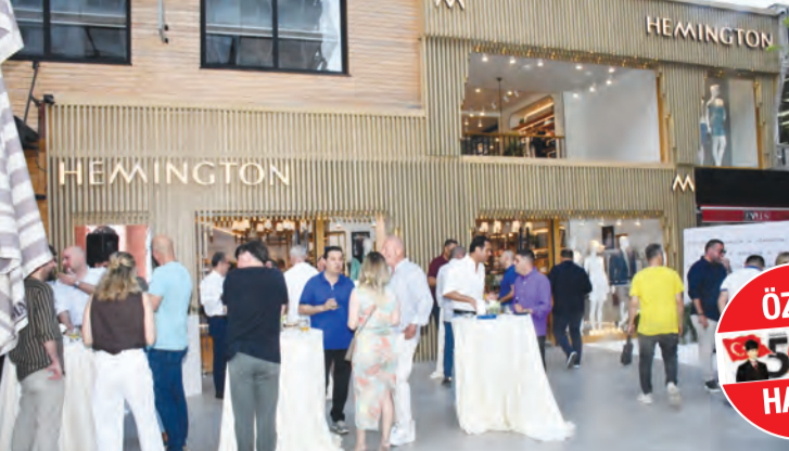
Premium erkek giyiminin öncü markası Hemington, 2026 Yaz Koleksiyonu'nu Ziyapaşa Bulvarı'ndaki mağazasında gerçekleşen şık bir kokteyle tanıttı