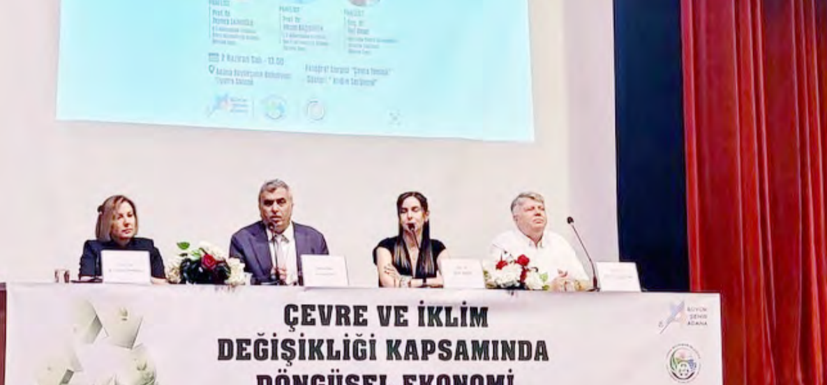
ÇEVRE VE İKLİM DEĞİŞİKLİĞİ KAPSAMINDA DÖNGÜSEL EKONOMİ