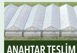
ANAHTAR TESLİM PROJELER

✓ PROFESYONEL YAKLAŞIM ✓ YÜKSEK KALİTE ✓ ZAMANINDA TESLİM ✓ UZUN ÖMÜRLÜ YATIRIM