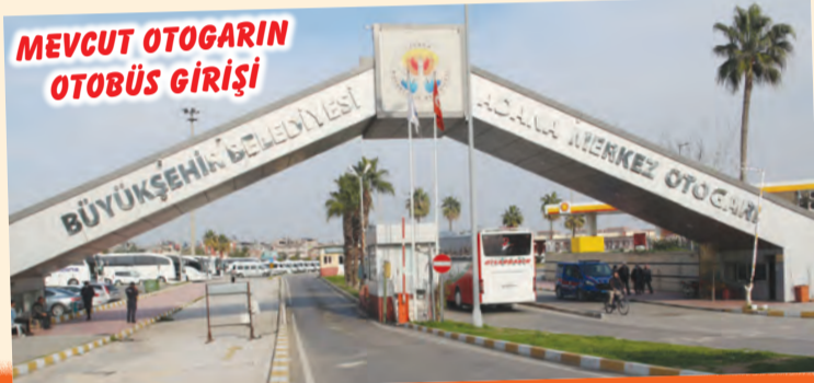
MEVCUT OTOGARIN OTOBÜS GİRİŞİ

Mevcut Otogarın Adana'ya yakışmadığını, daha modern ve çağdaş bir otogarın en kısa sürede kente kazandırılması gerektiğini belirten birçok haberi gazetemiz sütunlarına taşımıştık. 5 Ocak Gazetesi olarak haberlerin fikri takibini yapmaya devam ediyoruz