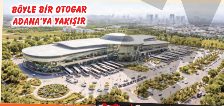
BÖYLE BİR OTOGAR ADANA'YA YAKIŞIR

5 Ocak Gazetesi olarak defalarca dile getirdiğimiz, Adana'nın adeta kanayan yarısı haline gelen mevcut otogar çilesi nihayet son buluyor