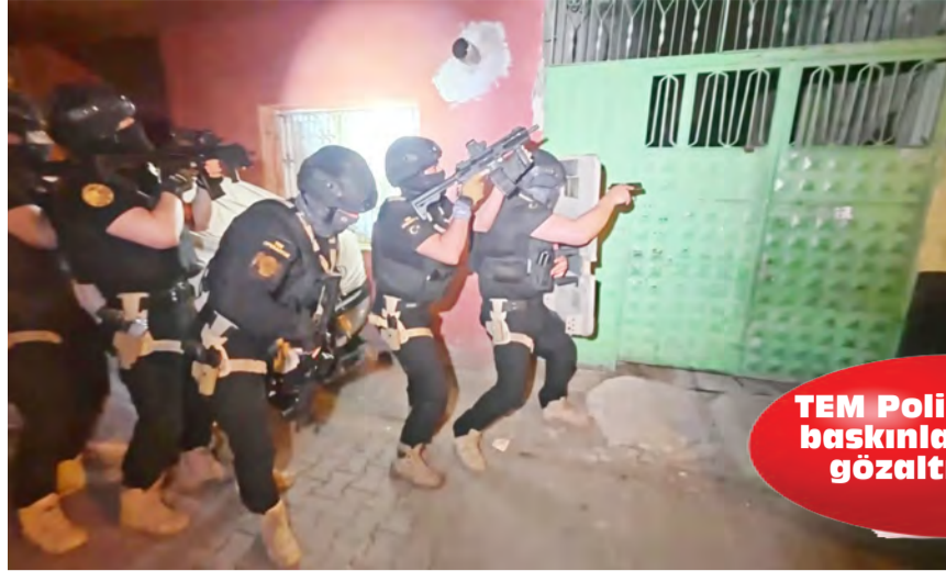
TEM Polisi yaptığı baskınla 16 kişiyi gözaltına aldı

Ve tarihin bize öğrettiği en net ders şudur; Doğayla savaşırsanız, kazanma şansınız yoktur. Kazandığınızı sandığınız an, aslında kaybettiğiniz andır.