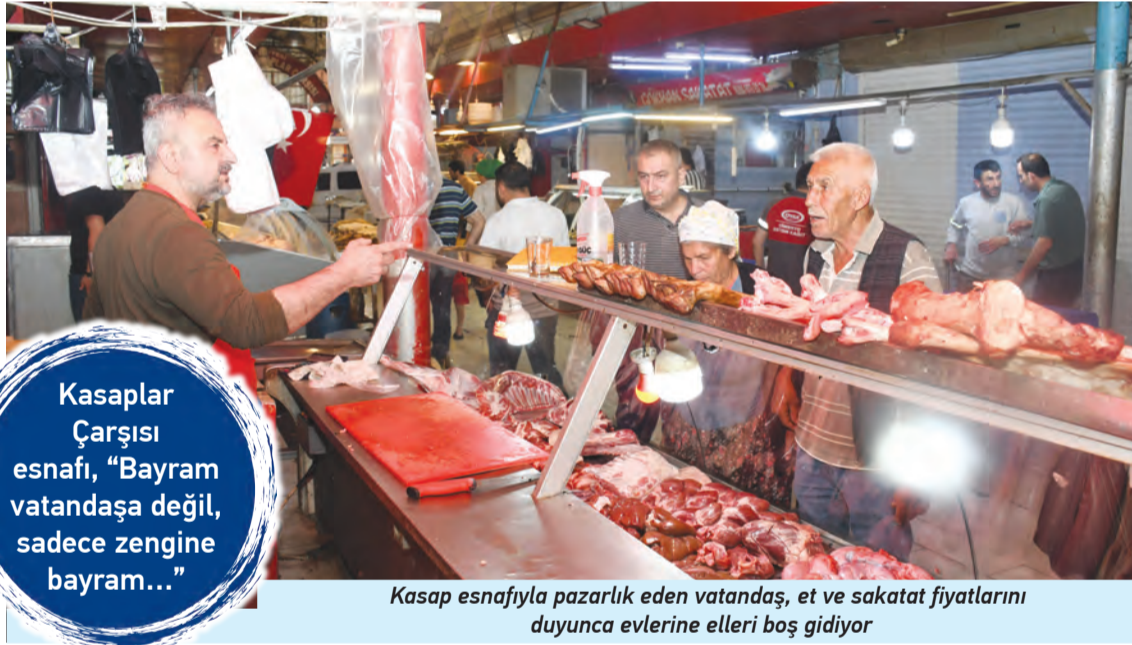
Kasap esnafıyla pazarlık eden vatandaş, et ve sakatat fiyatlarını duyunca evlerine elleri boş gidiyor