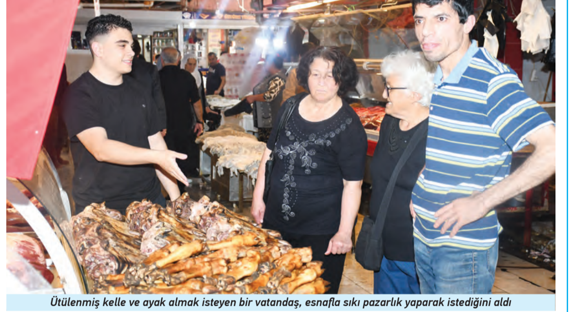
Ütülenmiş kelle ve ayak almak isteyen bir vatandaş, esnafa sıkı pazarlık yaparak istediğini aldı