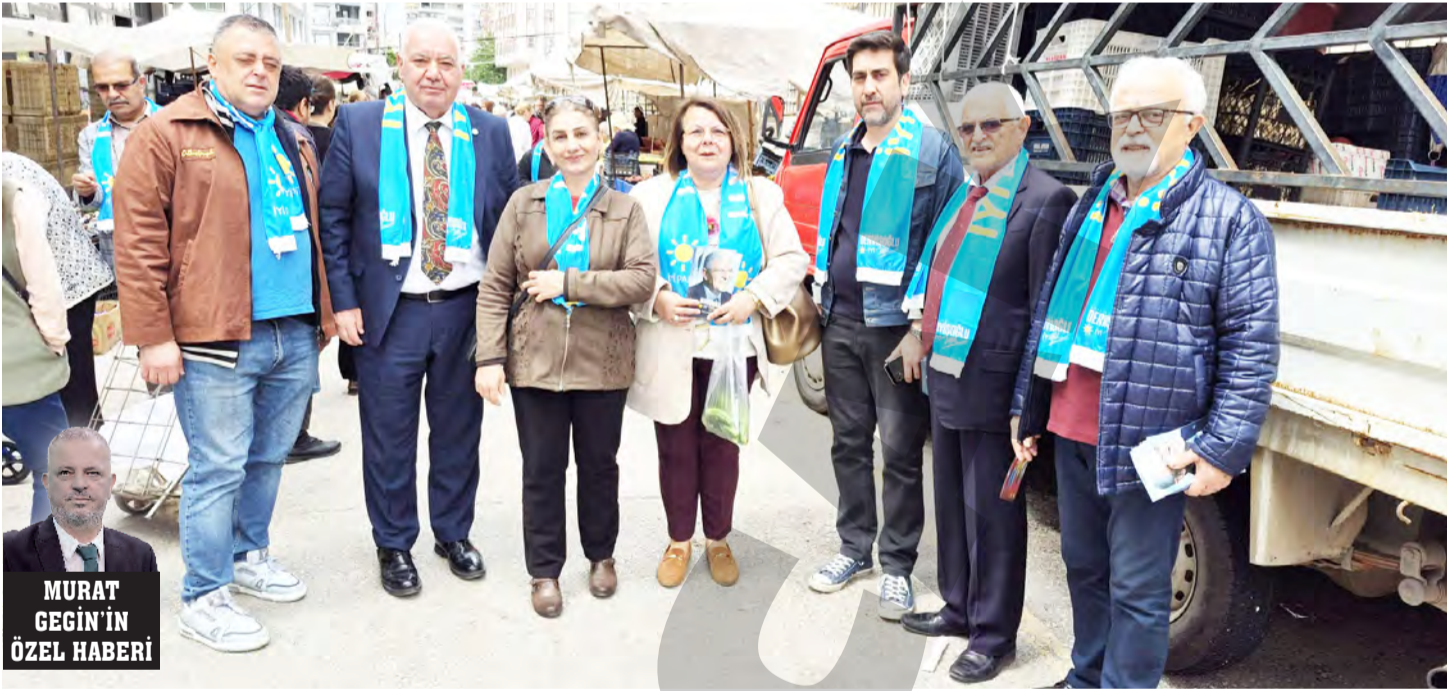
MURAT GEGİN'İN ÖZEL HABERİ

Ankara'da esen siyaset rüzgânı siyasi partileri olası bir erken genel seçim için hareketlendirdi. Vatandaş esnaf buluşmalarına özen gösteren İYİ Parti Seyhan İlçe teşkilatı, geçtiğimiz hafta içinde Kurtuluş ve Çınarlı mahallelerinde muhtar, vatandaş ve esnaf ziyareti gerçekleştirdi.