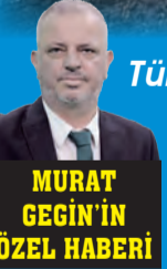
MURAT GEGIN'İN ÖZEL HABERİ

Türkiye'de ekonomik krizin faturası her geçen gün ağırlaşırken, temel gıda maddelerinden enerjiye kadar tüm kalemlere gelen zam sağanağı, halkı "tehlikeli" hayatta kalma yöntemleri uygulamaya zorluyor. Bir zamanlar "mutfağın demirbaşı" olan 12 kilogramlık ev tüpünün fiyatı bin 400 TL oldu. Vatandaş artık tüpünü değiştiremiyor; cebindeki son kuruşla LPG istasyonlarında "kaçak dolum" kuyruğuna giriyor.