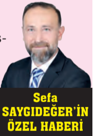
Sefa SAYGIDEĞER'İN ÖZEL HABERİ

Kıran ve Kalaycı ailelerinin bu mutlu günü, geniş katılımı ve coşkulu atmosferiyle Ünye'de uzun süre konuşulacak organizasyonlardan biri olarak hafızalara kazındı. Davetlilerin yoğun ilgisi ve samimi ortam, gecenin unutulmaz anlarla tamamlanmasını sağladı.