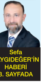
Sefa SAYGIDEĞER'İN HABERİ 3. SAYFADA

Adana Valisi Mustafa Yavuz öncülüğünde yürütülen Vizyon 2040 sürecinde dijital anketlere katılan 30 bin vatandaşın görüşleri yol haritasına dahil edildi. Katılımcı ve kapsayıcı yaklaşımın benimsendiği çalıştayda, halkın beklentileri ile uzman görüşleri bir araya getirilerek kentin geleceğine yön verecek stratejik kararlar için güçlü bir zemin oluşturuldu.