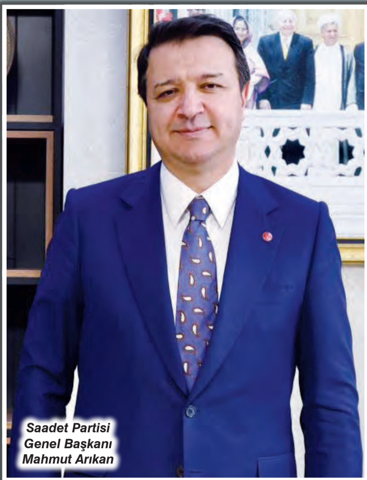
Saadet Partisi Genel Başkanı Mahmut Arkan

Mahmut Arkan: "Yeni nesil siyaset anlayışımız ile bunu aşyoruz. Siyasetteki yüksek perdeli bağırışmalar, aslında bir fikir yoksunluğunun maskesidir. Söyleyecek sözü olmayanlar sesini yükseltir. Biz, bağırmanın değil, hakikati fışıldamanın daha etkili olduğuna inanıyoruz. Siyasi arena bir savaş alanı değil, millete hizmet yarışıdır. Milli birliği sağlamanın yolu, muhalefeti "düşman" veya "hain" ilan etmekten vazgeçmektir. Bizim anlayışımızda devletin bekası, vatandaşın refahı ve huzuru ile eş değerdir. Kavga ederek değil, müzakere ederek, ortak paydalarda buluşarak Türkiye'yi düzlüğe çıkarabiliriz."