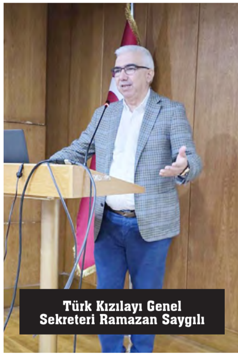
Türk Kızılayı Genel Sekreteri Ramazan Saygılı

ci kazandırmayı hem de iyilik odaklı toplumsal sorumluluk anlayışını güçlendirmeyi amaçladı. Üniversiteli gençlerin yoğun ilgi gösterdiği program, Kızılay'ın köklü değerlerinin yeni nesillere aktarılması açısından önemli bir buluşma olarak değerlendirildi. (5 OCAK/TÜRK KIZILAYI/BÜLTEN)