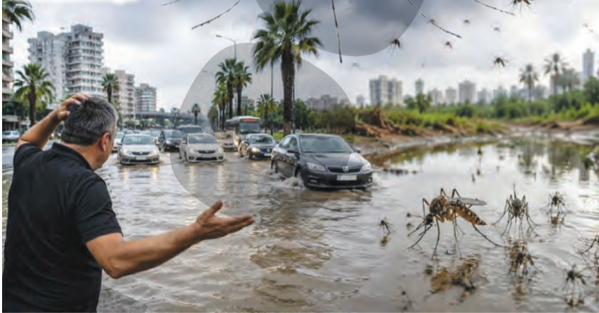
YZ ile hazırlanmıştır

Yaşanan bu çaresizlik karşısında Adanalılar, sorunlarına çözüm bulabilmek adına Adana Büyükşehir Belediyesi'nin ALO 153 Çağrı Merkezi'ni adeta telefon yağmuruna tuttu. Çağrı merkezi operatörlerinin basmakalıp sözlerle vatandaşı geçiştirdiğini belirten mahalle sakinleri, yaşadıklarını ve tepkilerini şöyle dile getirdi: "Günlerdir telefonun ucundaki yetkililer bize sadece 'Şikâyetiniz için kayıt açılmıştır' demekle yetiniyor. Sistemde yüzlerce kayıt var ama sokakta ne bir ilaçlama aracı var ne de bir görevli. Açıkça görüldüğü ki sinekler belediyenin sistemdeki kayıtlarından korkmuyor, acilen sahada somut bir icraat görmek istiyoruz."