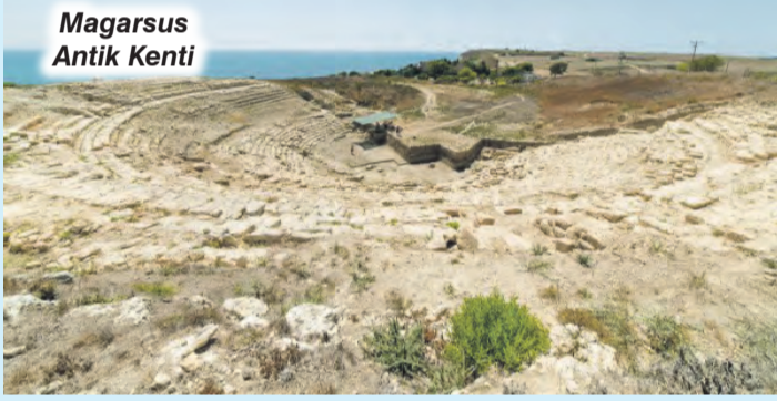
Magarsus Antik Kenti

Bereketli Topraklar Tarım Kooperatifi ve Yer Fıstığı Tesisi: Bölge çiftçisi için stratejik bir ürün olan yer fıstığının katma değerini artırmak amacıyla, fıstığın işleneceği modern bir tesisin yakında hayata geçirileceği müjdelendi.