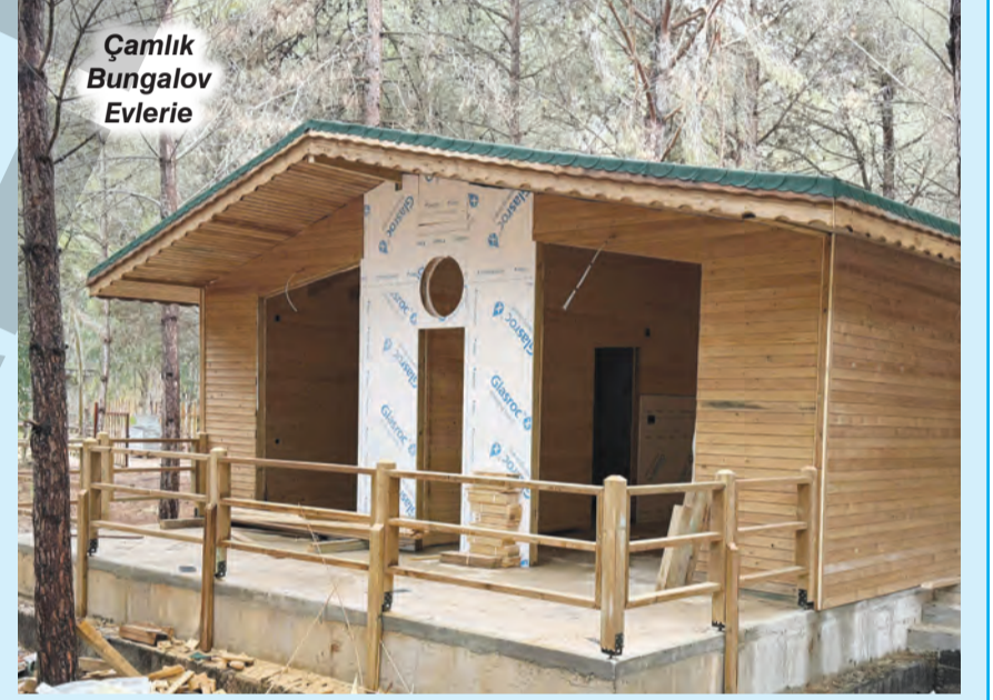
Çamlık Bungalov Evleri

Yaz sıcaklarının kendini göstermeye başladığı Adana'da vatandaşın kâbusu geri döndü; SİVRİSİNEK