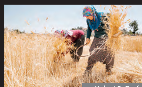
☛ Haberi 3. Sayfada