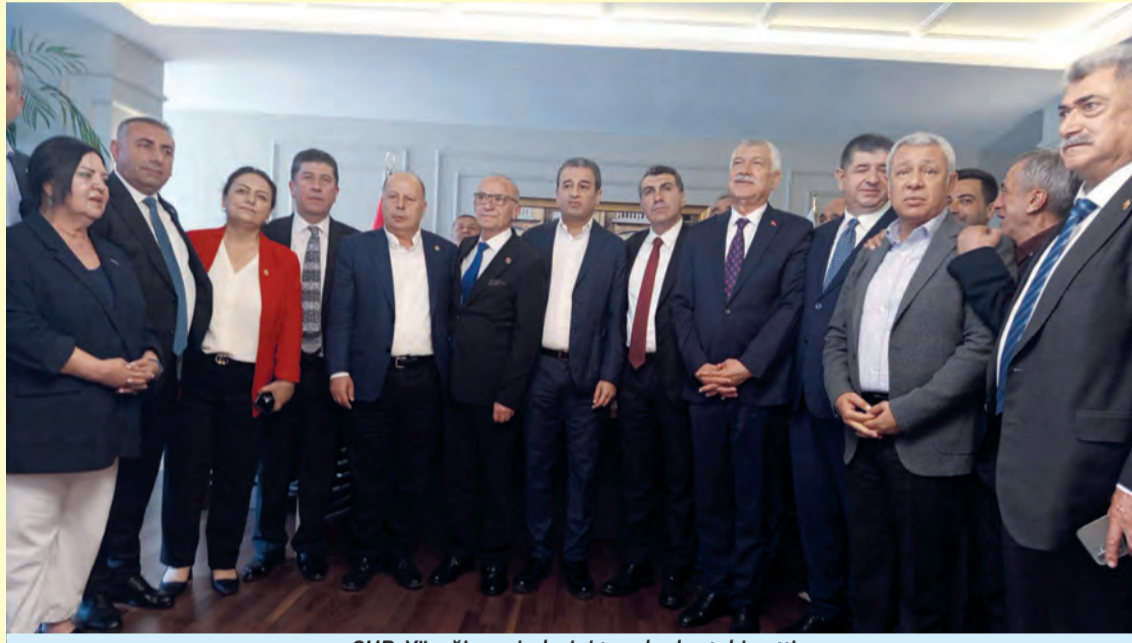
CHP, Yüreğir seçimlerini tam kadro takip etti