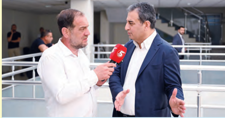
CHP Genel Başkan Yardımcısı ve Adana Milletvekili Burhanettin Bulut, 5 Ocak TV Genel Yayın Yönetmeni Serden Çevik'in sorularını yanıtladı

Meclis üyelerine çalışmalarında başarılar dileyen Özgür Özel, "Hepinize çok teşekkür ediyorum, çok kolay gelsin. Hepinizi ayrı ayrı kutluyorum" diyerek konuşmasını sonlandırdı.