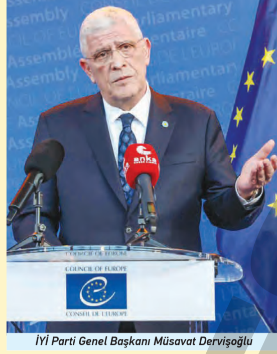
İYİ Parti Genel Başkanı Müsavat Dervişoğlu