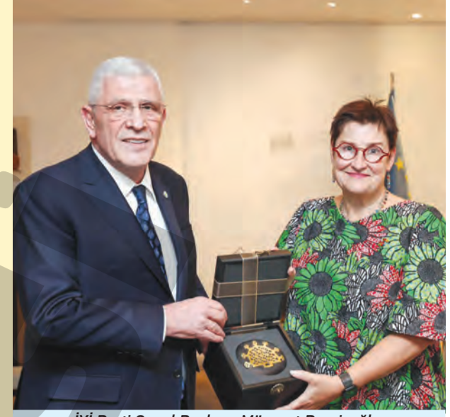
İYİ Parti Genel Başkanı Müsavat Dervişoğlu: Avrupa Konseyi Parlamenter Meclisi Başkanı Sayın Petra Bayr ile bir araya geldik. Ev sahiplikleri için teşekkür ediyorum.