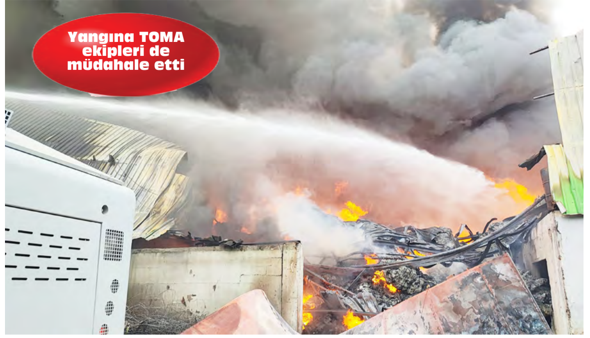
Yangına TOMA ekipleri de müdahale etti