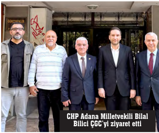
CHP Adana Milletvekili Bilal Bilici ÇGC'yi ziyaret etti