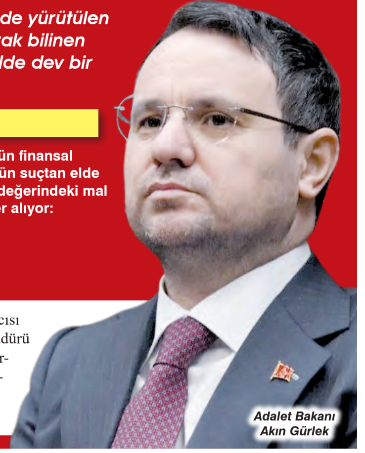
Adalet Bakanı Akın Gürlek