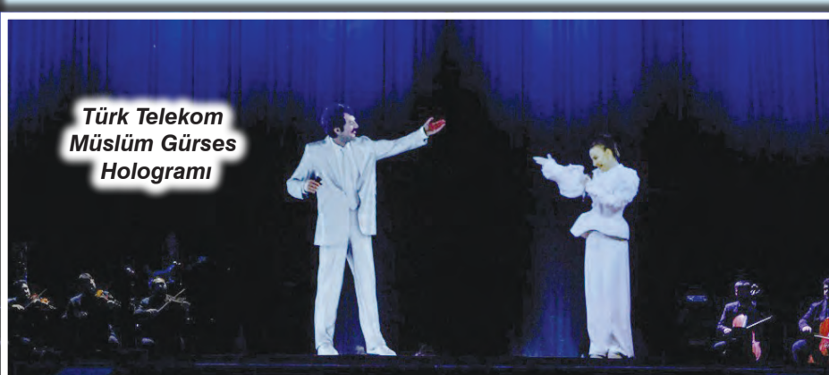
Türk Telekom Müslüm Gürses Hologramı