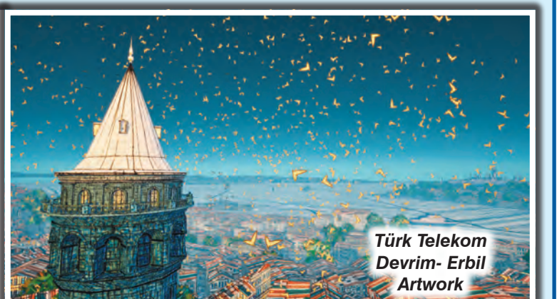
Türk Telekom Devrim- Erbil Artwork