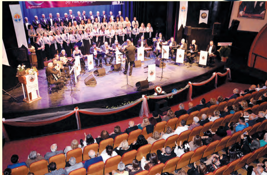
Usta sanatçının her konseri, sanatseverlerin büyük beğenisini ve ilgisini topluyor