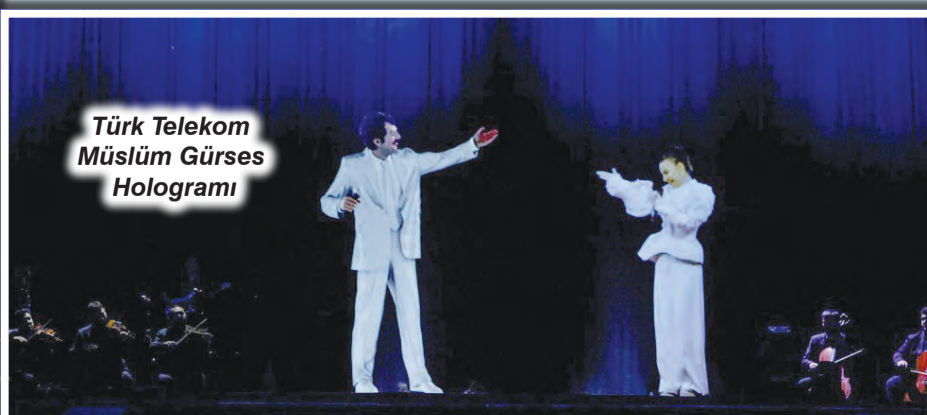
Türk Telekom Müslüm Gürses Hologramı