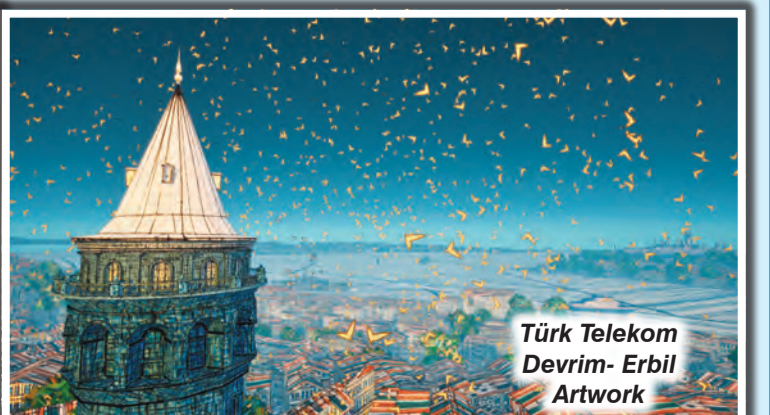
Türk Telekom Devrim- Erbil Artwork