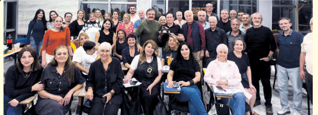
Adana Öğretmenler Korosu, bugün 44 yıllık geçmişiyle Türkiye'de aynı isim ve aynı şefle devam eden tek oluşum olma unvanını taşıyor.

Türk Sanat Müziği'ne gönülden bağlı tüm sanatseverlerin davetli olduğu bu anlamlı gecede, 50 yıllık bir birikim sahnede devleşecek. Slaytlar eşliğinde geçmişe yolculuk yapılacak olan bu özel akşam, sadece bir konser değil, bir vefa gecesi olarak tarihe geçecek.