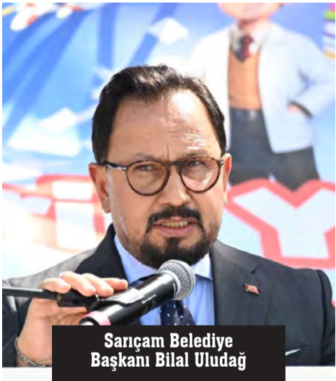
Sarıçam Belediye Başkanı Bilal Uludağ