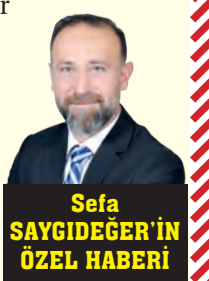
Sefa SAYGIDEĞER'İN ÖZEL HABERİ

Yapılacak dekoratif bir ışıklandırma, köprüyü yalnızca bir ulaşım hattı olmaktan çıkarıp, şehrin gece kimliğini şekillendiren bir simgeye dönüştürebilir. Adana'nın sahip olduğu potansiyelin daha görünür hale gelmesi için bu tür dokunuşların önemli olduğuna dikkat çekiyor ve Adana'nın inci gerdanlığı artık sadece gündüz değil, geceleri de ışıldasın istiyoruz.