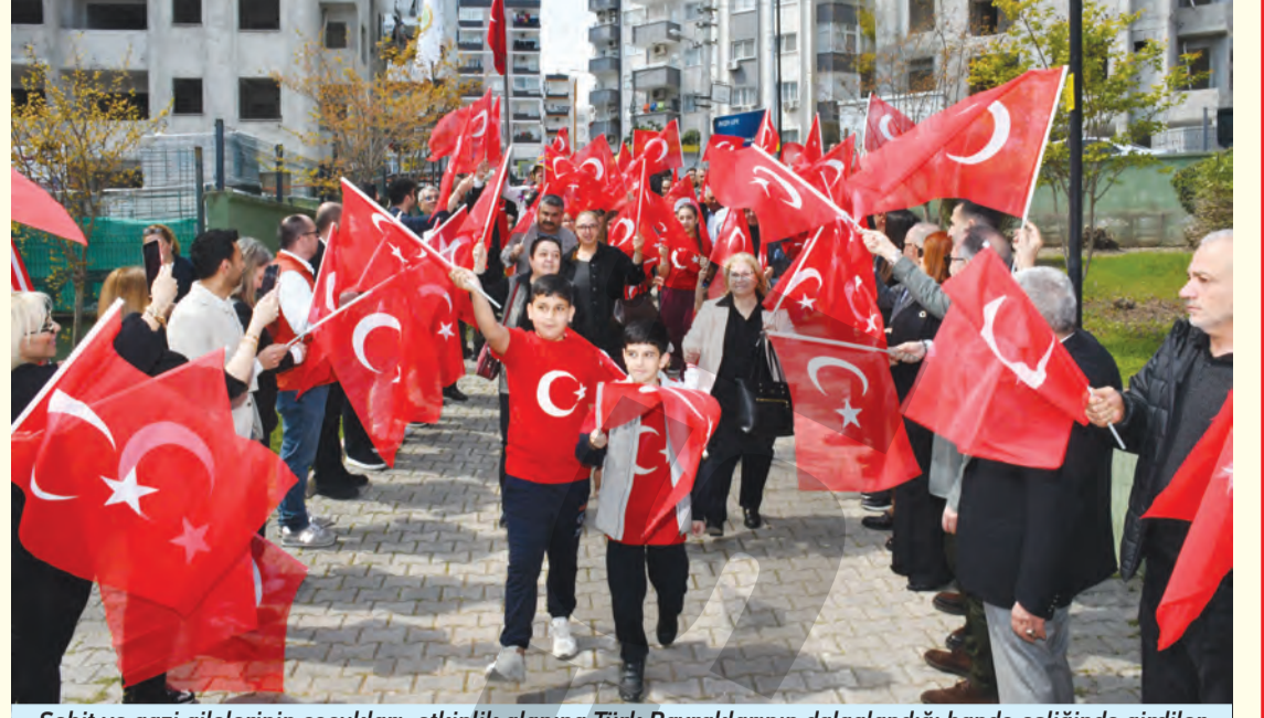
Şehit ve gazi ailelerinin çocukları, etkinlik alanına Türk Bayraklarının dalgalandığı bando eşliğinde girdiler