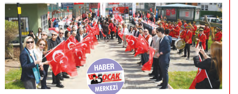
HABER 5 OCAK MERKEZİ

→ Biz De Varız Destekleme Derneği ve Adana Rotary Kulübü'nce 18 Mart Çanakkale Zaferi'nin 111. Yıl Dönümü etkinlikleri kapsamında bu yıl beşincisi düzenlenen 'Şehitleri Unutmadık, Unutmayacağız' konulu Karma Spor Etkinliği geniş katılımıyla gerçekleştirildi. Şehit Anaları Spor Kompleksi'nde düzenlenen programda basketbol, badminton, oyun parkuru, körling oyunları, resim ve boyama etkinliği yapıldı. Haber 7. Sayfada