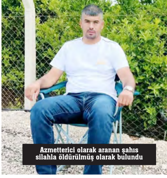
Azmettirici olarak aranan şahıs silahla öldürülmüş olarak bulundu

İddiaya göre, 13 Mart günü gece saatlerinde kentteki bir kebabçıya silahlı saldırı düzenlendi. Kimliği belirsiz kişi ya da kişiler tarafından