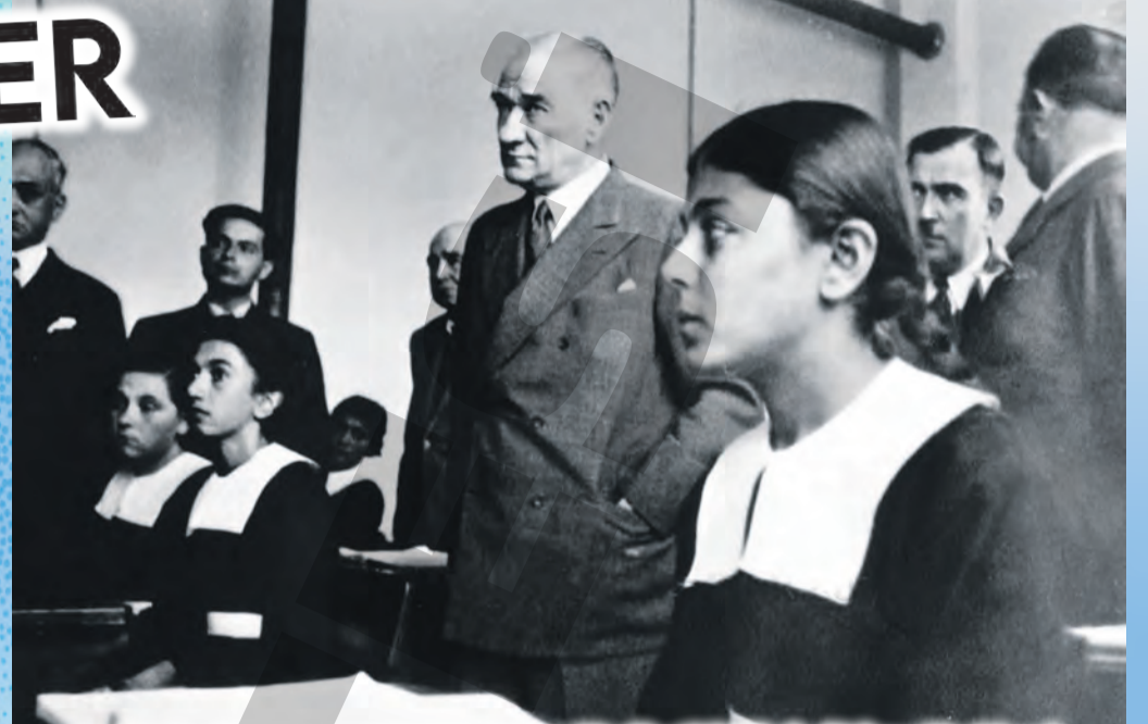
Bu fotoğraf 19 Kasım 1937'de Adana Kız Enstitüsü'nde (Adana Kız Lisesi-tarihi taş bina) çekildi. Ulu Önder Mustafa Kemal Atatürk, Tarih dersine girerek öğrencilerle sohbet etmişti. Atatürk, tüm öğretmenlere olan saygısını göstermek için dersi ayakta dinlemişti...